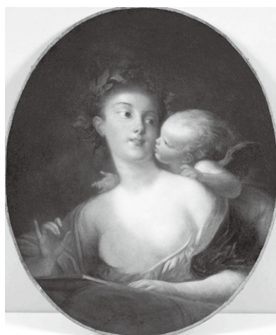
ジャン・オノレ・フラゴナール 《キューピッドのささやき》 1776-77年

点線を切り取り、美術館受付にてご提示ください。 ※本券ご持参の方を含む5名まで有効 ※コピー不可/その他の割引との併用不可 お問い合わせ:ヤマザキマザック美術館