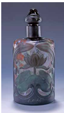
ウジェーヌ・ミッシェル 《草花文香水瓶》1900 年頃

ロココからエコール・ド・パリまでの絵画や、エミール・ガリに代表されるアール・ヌーヴォーのガラス工芸、家具など、フランス美術 300 年が一望できる作品が一堂に会します。約 160 点の主要なコレクションをご鑑賞いただけます。