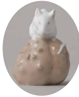
ロイヤル コペンハーゲン《釉下彩に胡桃置物》 1910-17年 塩川コレクション

19世紀末から20世紀初頭にかけて欧米で流行したアール・ヌーヴォーの時代に、デンマークから世界に向けて発信された美しく愛らしい「釉下彩（ゆうかさい）」の数々を紹介いたします。