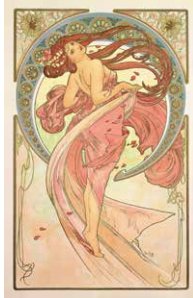
アルフォンス・ミュシャ 《舞踏—連作(四芸術)より》(部分) 1898年 カラーリトグラフ ミュシャ財団蔵

アルフォンス・ミュシャ(1860-1939)の作品は、「線の魔術」ともいえる曲線美を特徴とし、多くの人に親しまれています。この展覧会ではミュシャの作品群はもちろんのこと、彼から影響を受けた後世のアーティストの作品を含めおよそ250点を展示します。