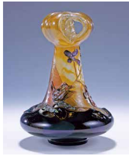
エミール・ガレ《ニオイアラセイトウ文花器》 1900年

ロココからエコール・ド・パリまでの絵画や、エミール・ガレに代表されるアール・ヌーヴォーのガラス工芸、家具など、フランス美術300年が一望できる作品が一堂に会します。約180点の主要なコレクションをご鑑賞いただけます。