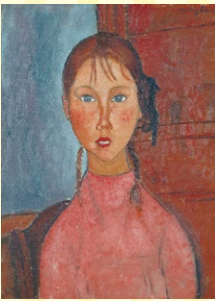
アメデオ・モディリアーニ「おかげ髪の少女」 1918年頃 名古屋市美術館蔵

名古屋市美術館所蔵のモディリアーニ、シャガール、フリーダ・カーロ、草間彌生など代表作から知られざる傑作まで、一挙公開します!