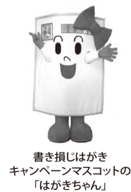
書き損じはがき キャンペーンマスコットの 「はがちゃん」

「世界寺子屋運動」書き損じ はがきキャンペーンにご協力 いただきまして誠にありがとう ございました。 市老連会員の皆さまから寄 せられた書き損じはがきは 2056枚、切手235枚で、 お金に換算すると10万3757 円相当でした。