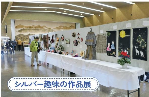
シルバー趣味の作品展

スポーツ関連では、5月と11月にグラウンド・ゴルフ大会、6月にカローリング大会、8月にボッチャ大会、翌年2月にクロリティー大会を予定しています。その他、7月に健康教室、12月にシルバー趣味の作品展を計画しています。 令和8年度も、会員の皆さんに楽しんでいただけるよう関係者一同事業を盛り上げていきたいと思えます。 （武田 伸）