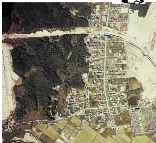
1977年梅が丘(当時は梅森坂)航空写真