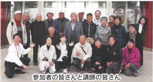
参加者の皆さんと講師の皆さん

(木)、15日(金)に役員 研修旅行を実施し、20名 の南区老連役員が参加し ました。