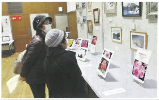
多くの来場者の目を楽しませました