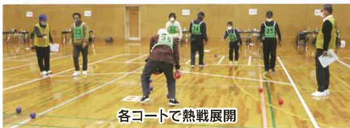
各コートで熱戦展開

令和5年12月1日(金)、第1回ボッチャ競技大会が東スポーツセンターにて開催されました。 今大会には、16区から各3名1チーム、計48名が参加しました。参加者の皆さんは、上位をめざし真剣勝負。一発逆転となることもあるため、最後まで目が離せません。 1試合4エンドで2試合行われ、結果は東区が優勝、南区は健闘し8位となりました。