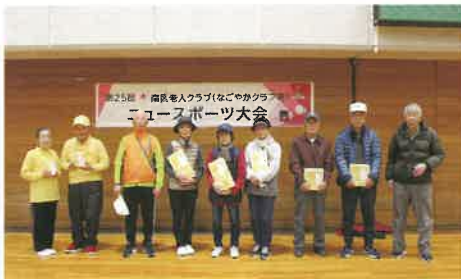
【ボッチャ】入賞者の皆さん