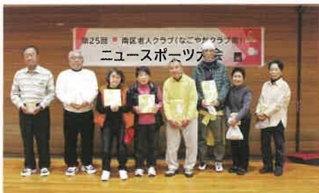
【クロリティー】入賞者の皆さん