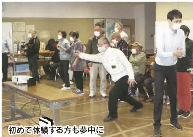
初めて体験する方も夢中に

令和6年3月13日 (水)、市総合社会福祉会館にて、テレビスポーツゲーム体験会が開催され、南区からも参加しました。 会場では、任天堂スイッチを使ってスポーツの疑似体験を通じて実際に手を動かしたり、駆け引きを考えるなど楽しみました。 市老連では今後、テレビゲームの普及に力を入れ、認知症予防のためにも役立てていくとのことです。