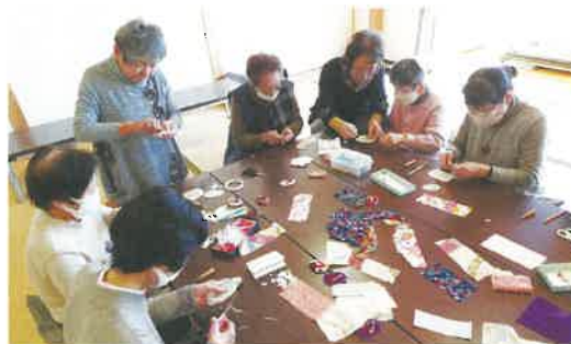
ともに教えあいながら作りました

また、皆さんで教えあいながら研修を進めるうちに女性リーダー間の一体感が生まれ、作品を作り上げた際は、いつも以上に充実感を得ることができました。