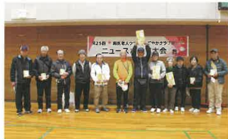
【カローリング】入賞者の皆さん