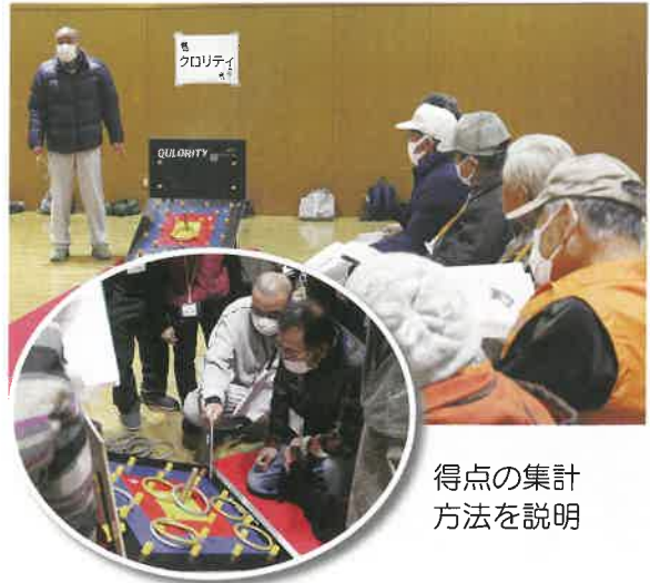
得点の集計方法 を説明